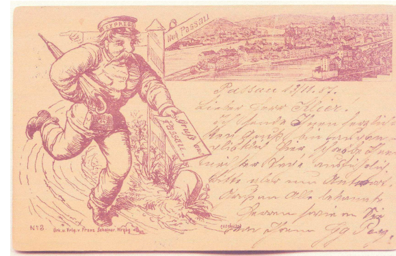
Scheiner-Karte mit Poststempel Passau 13.11.1887