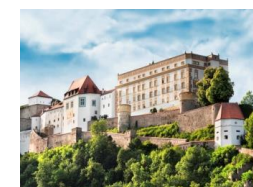
Personalisierte Marke 70 Cent

Bei beiden Briefmarken muss noch abgewartet werden, wann die Deutsche Post die Portokosten erhöht. Voraussichtlich wird dies wohl erst im Herbst der Fall sein, so dass noch mit den alten Portokosten gerechnet werden kann.