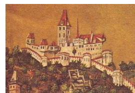
Personalisierte Marke 45 Cent